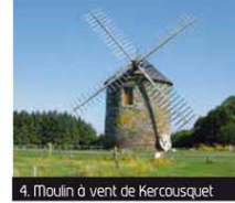
4. Moulin à vent de Kercousquet