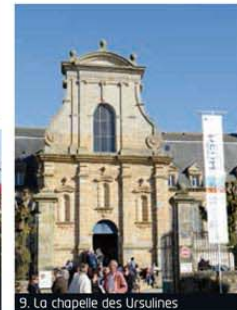
9. La chapelle des Ursulines