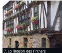
7. La Maison des Archers