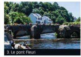
3. Le pont Fleuri