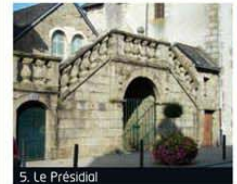
5. Le Présidial