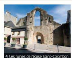
4. Les ruines de l'église Saint-Colomban