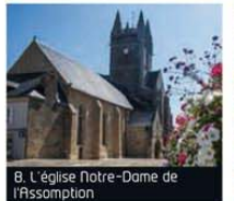
8. L'église Notre-Dame de l'Assomption