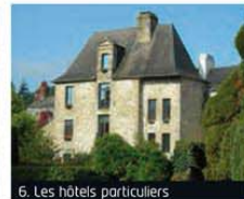
6. Les hôtels particuliers