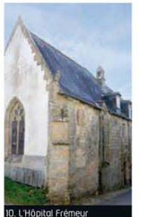
10. L'Hôpital Frémur