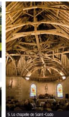
5. La chapelle de Saint-Cado