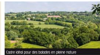
Cadre idéal pour des balades en pleine nature