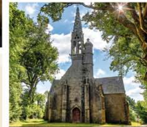
2. Chapelle de la Véronique