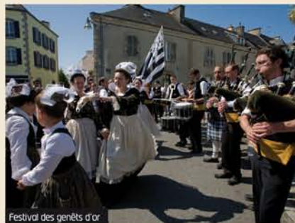
Festival des genêts d'or

Riche d'un patrimoine remarquable et diversifié, Bannaec séduit les inconditionnels de patrimoine et de randonnées. Nichés au cœur de vallées verdoyantes, chapelles et oratoires se laissent découvrir au fil des balades empruntant des chemins où la nature sauvage est reine. Dolmens et allées couvertes sont autant de témoins du riche passé de la commune. Tous les ans, Bannaec vibre pour ses rendez-vous culturels « Les passeurs de lumière » (rendez-vous autour du cinéma) en novembre et le « Festival des genêts d'or » en août (fête des vieux métiers, concerts, noces bretonnes...). Bannaec est reconnue pour son dynamisme et sa convivialité issus de son riche tissu associatif. La garantie d'un séjour alliant culture et nature !