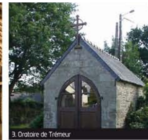
3. Oratoire de Trémeur