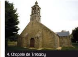
4. Chapelle de Trébalay