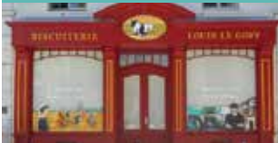
Biscuiterie, Chocolatier, Cidre, Produit apicole