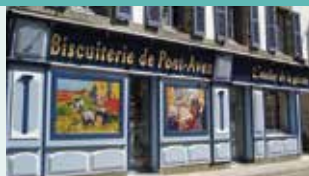
Biscuits, Kouign-amann, Épicerie fine bretonne, Cave, Souvenirs