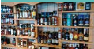
Bières, Cidre, Spiritueux, Vins