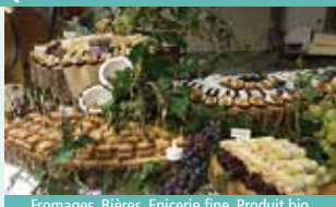
Fromages, Bières, Epicerie fine, Produit bio, Produit laitier, Salaisons, Vins