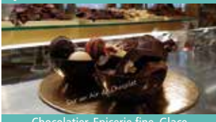
Chocolatier, Epicerie fine, Glace