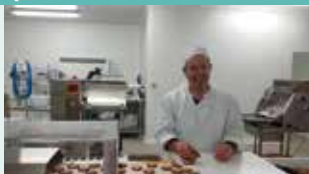
Bières, Biscuiterie, Chocolatier, Cidre, Epicerie fine, Produit apicole