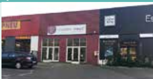
Vins, spiritueux, bières, épicerie fine