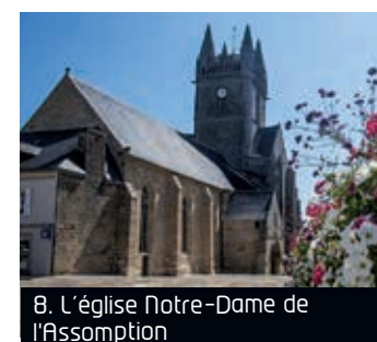
8. L'église Notre-Dame de l'Assomption