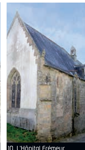
10. L'Hôpital Frémeur

2 Les Halles Les halles de Quimperlé ont été réalisées en 1887 par les frères Moreau, constructeurs à Paris. Contemporaines de la Tour Eiffel, elles ont été construites au cœur même du quartier historique et restaurées en 2002. L'intérieur du marché est occupé par des poissonniers, bouchers, charcutiers et épiciers.