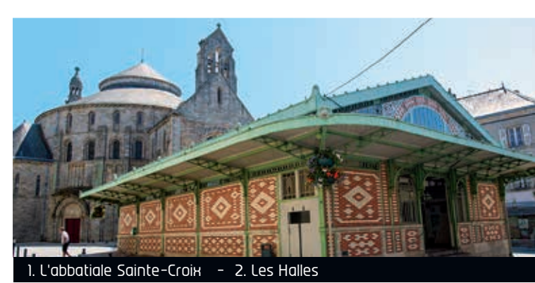
1. L'abbatiale Sainte-Croix - 2. Les Halles