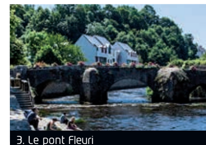
3. Le pont Fleuri