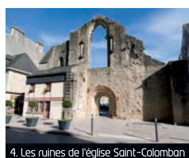
4. Les ruines de l'église Saint-Colomban

1 L'abbatiale Sainte-Croix Classée Monument Historique L'église abbatiale de Sainte-Croix a été construite au XI e siècle. Ce monument est remarquable par son plan cruciforme et circulaire. L'écroulement du clocher (du XVII e ), le 21 mars 1862, a entraîné la destruction d'une partie de l'église. Le chœur des moines, un joyau de l'art roman, et la crypte, l'une des plus belles de Bretagne, sont restés intacts. L'église renferme un riche mobilier, une mise au tombeau (vers 1500) et un retable Renaissance (1541). Les bâtiments conventuels et le cloître sont aujourd'hui occupés par la gendarmerie.