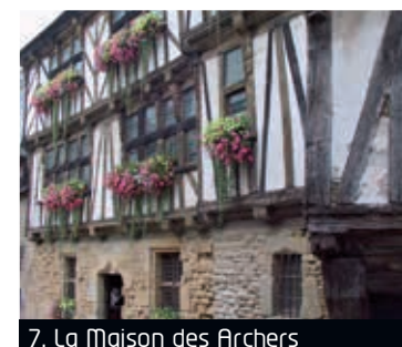
7. La Maison des Archers