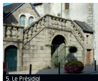
5. Le Présidial