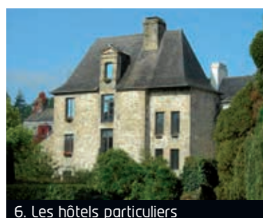
6. Les hôtels particuliers