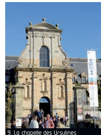
9. La chapelle des Ursulines