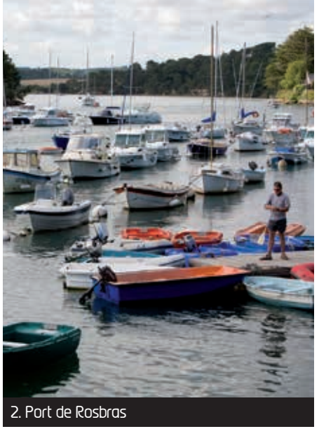
2. Port de Rosbras