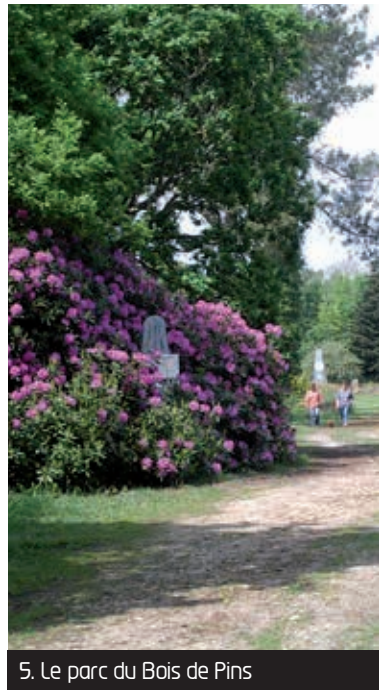
5. Le parc du Bois de Pins