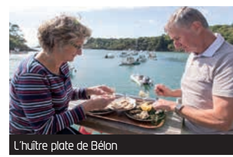
L'huître plate de Bélon