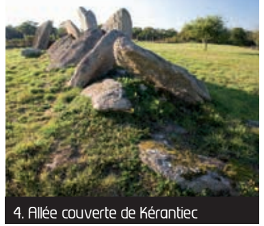
4. Allée couverte de Kéraniec