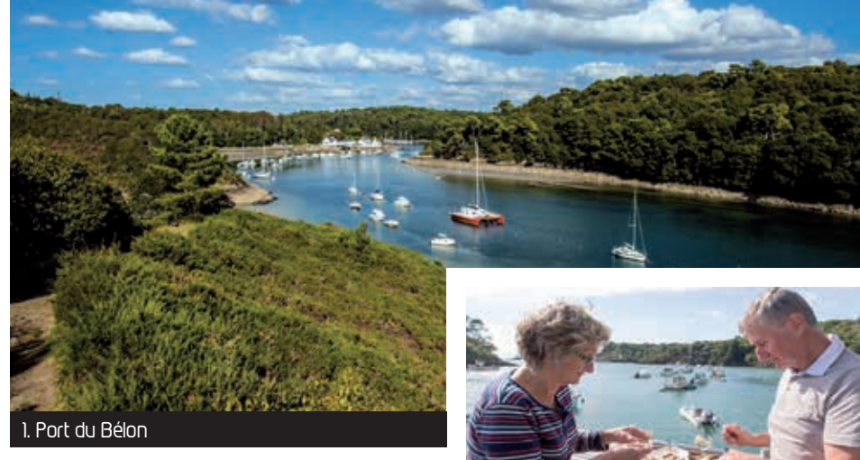
1. Port du Bélon

Bordée par l'Aven et le Bélon, la commune de Riec-sur-Bélon est la capitale de la célèbre huître plate : la Bélon. C'est ici que Mélanie Rouat concocta ses célèbres recettes comme le homard à la crème ou encore les palourdes grillées. Faites une halte dans un des élevages ostréicoles pour une dégustation inoubliable avec vue sur mer. Une fois sur les rives, on succombe à la poésie des paysages et à la lumière des rias qui évoluent aux rythmes de la journée et des marées. En empruntant le GR34, ports confidentiels, criques et petit patrimoine se dévoileront au fil de vos escapades.