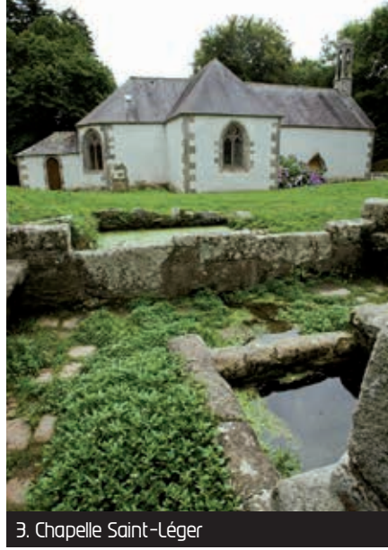
3. Chapelle Saint-Léger