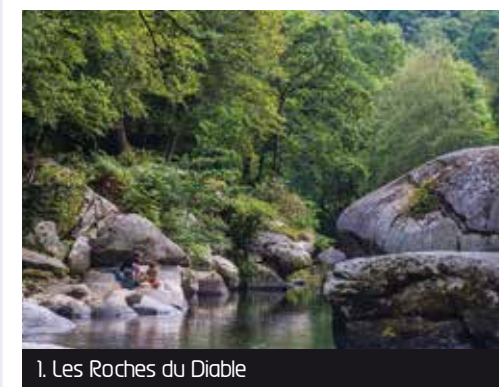
1. Les Roches du Diable