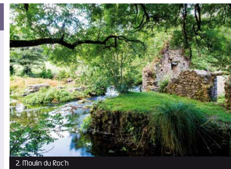
2. Moulin du Roc'h